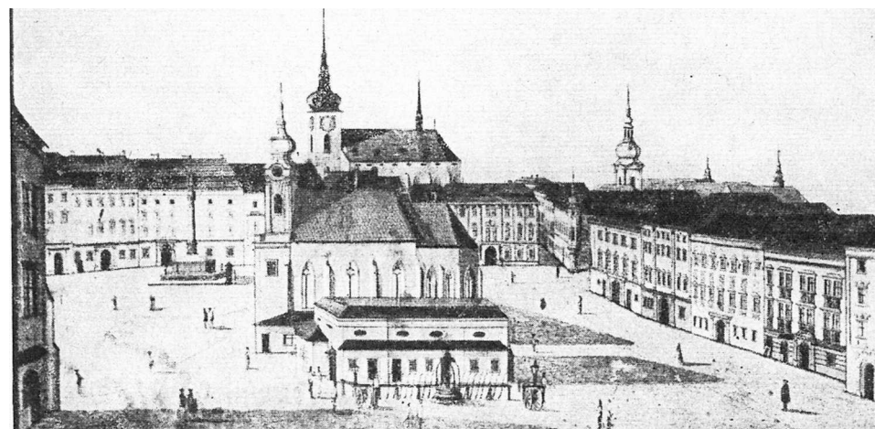
Náměstí Svobody po roce 1749