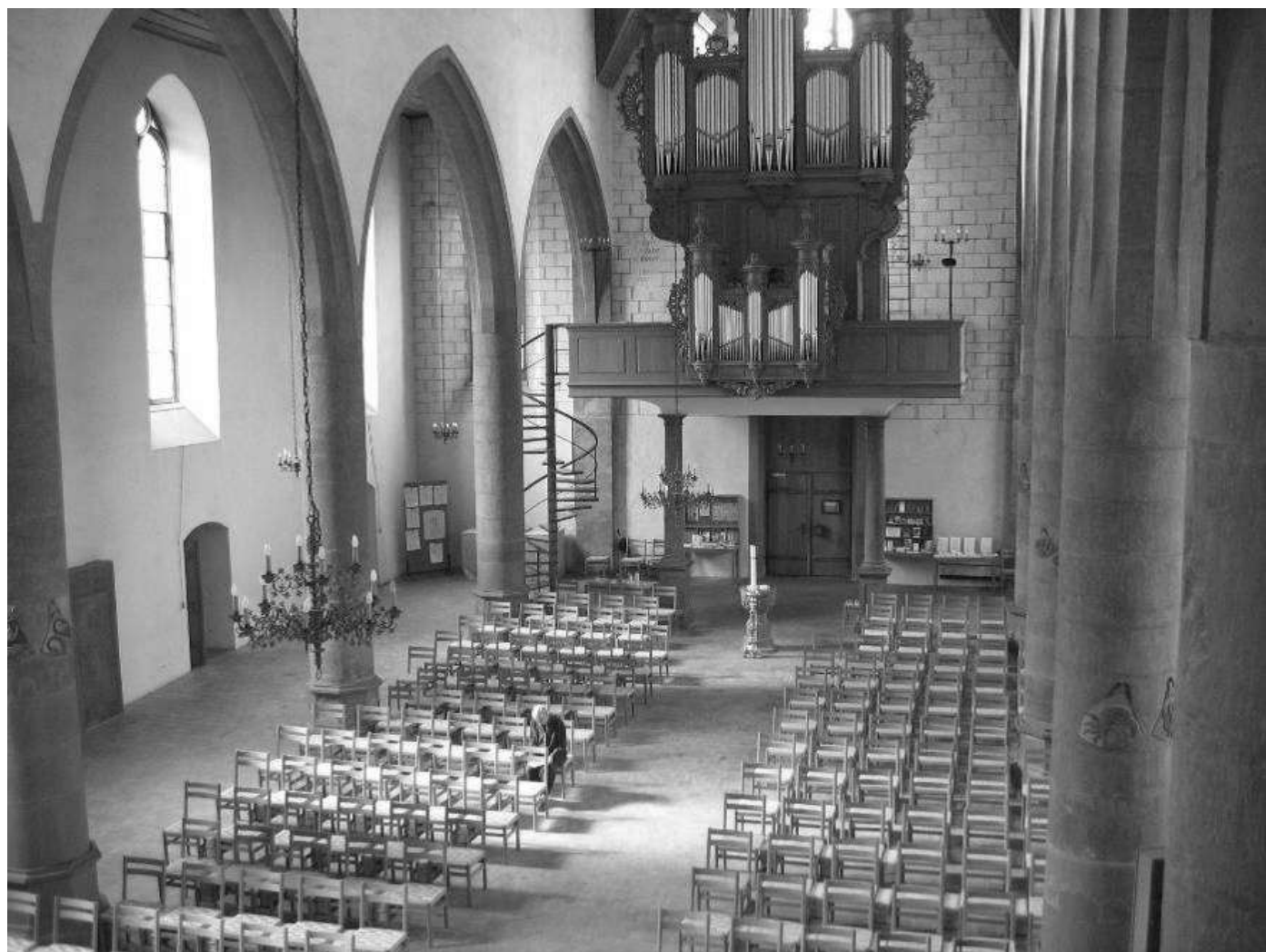
Kostel řádu dominkánů v Basileji, kde probíhala jednání koncilu

Vyhlášení kompaktát r. 1436 v Jihlavě mělo přinést mír v zemi, na jedné straně zaručit určitou svobodu vyznání, na druhé pak přijetí Zikmunda za krále. V této nové situaci se Payne přidal na stranu Jana Rokycany, zvoleného arcibiskupa církve podobojí, k nelibosti táboritů. Paynovo postavení v zemi však nebylo dobré. Král Zikmund s ním měl nevyřízené účty, využil vhodné příležitosti a vypověděl ho ze země. Payne ale neodešel a skryl se u přátel v husitských městech. Také Rokycana, který nebyl nikdy jako arcibiskup králem ani katolíky uznán, musel odejít z Prahy. Král, snažící se prosadit svoji představu kompaktát, klid zemi nepřinesl, naopak vzbuzoval stále větší odpor. Nakonec musel Prahu rychle opustit a cestou do Uher na Moravě zemřel. Payne byl při jedné z cest zajat katolickým šlechticem, který se na něm chtěl obohatit a za jeho propuštění požadoval značné jmění. Ve vězení strávil dva roky, než se podařilo táboritům jej vykoupit. Po propuštění se znovu věnoval svému poslání být prostředníkem mezi husitskými stranami. Poslední velkou cestou bylo Rokycanovo poselství do Cařihradu r. 1451 k východní církvi ve snaze navázat bližší spolupráci. K té však nedošlo. Poslední léta prožil Payne v klášteře na Slovanech, kde ho často navštěvoval Rokycana, s nímž se spřátelil. Tady se také poznal s hospodářským správcem kláštera Řehořem, pozdějším zakladatelem Jednoty bratrské. O tom však někdy později.