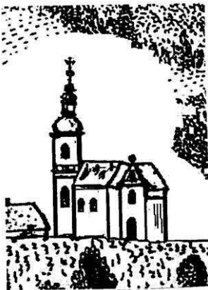
Podoba kostela v Líšni před rokem 1727

Už v roce 1306 se objevuje zmínka o líšeňském kostele, který byl původně filiálním kostelem farního chrámu ve Šlapanicích, a později naopak sem patřila Slatina a je tomu tak dodnes. V kostele byly při přestavbách objeveny románské prvky a gotické zdi. V letech 1609-1614 za Hynka Bořity z Budče byl kostel přestavěn a rozšířen směrem na východ a po více než jednom století proběhla barokní přestavba a byla vystavěna kostnice pro pozůstatky, které se objevily při dalším rozšiřování kostela, který stál uprostřed hřbitova. Nejzajímavější zpráva je o velkém požáru v Líšni 17. 5. 1794, kdy shořelo mnoho domů včetně fary a částečně i kostel. Několik lidí při požáru uhořelo. Nejprve se opravoval kostel. Byla snížena a provizorně zastřešena věž. Tento vnější vzhled věže trvá dodneška, i když většina lidí už neví, že je památkou na rozsáhlý požár v 18. století. Úpravy, rozšiřování a opravy kostela probíhají až dodnes, v letech 1895 a 1929 se zasloužili o obnovu kostela Belcrediové. Od roku 1944 je Líšeň součástí Brna. Kostel nyní spravují salesiáni, kteří odvádějí obdivuhodnou sportovní a evangelizační činnost, hodnou následování, zvláště na sídlišti v Líšni, kde je už vystavěna sportovní hala, v ní se konají pravidelné bohoslužby početně navštívené zvláště mladými lidmi, a oratoř pro různé kroužky mládeže a dětí.