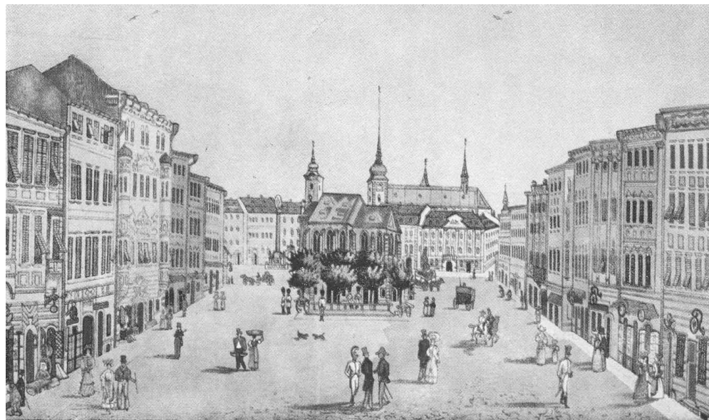
Dolní trh (dnešní náměstí Svobody) v roce 1820