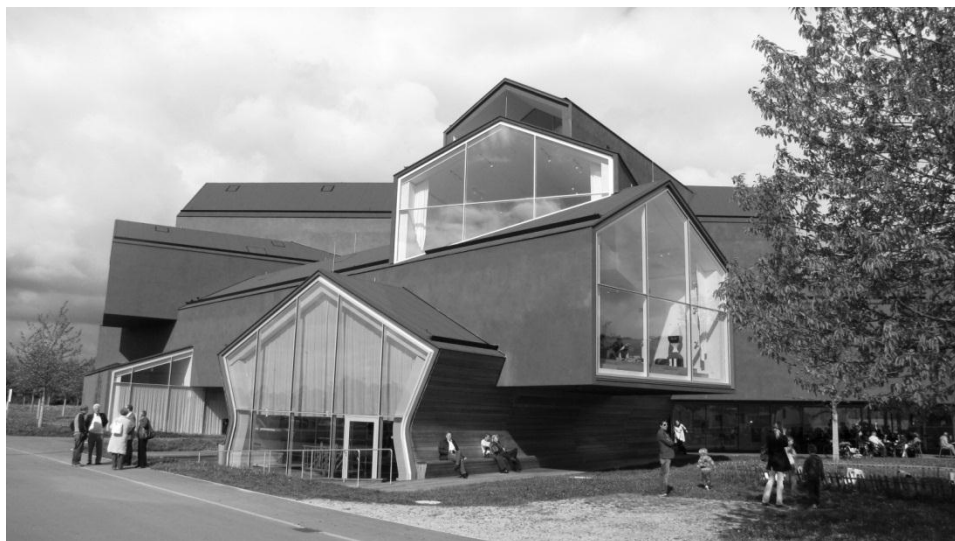
Areál nábytkářské firmy Vitra

V pondělí ráno jsme přejeliauty do obce Hergiswil na břehu jezera Vierwaldstättersee u Luzernu. Navštívili jsme zdejší sklárnu, která po století prosperity v 70. letech téměř zanikla. Nový majitel však výrobu převedl na ruční sklo a firma je dnes opět úspěšná. Prošli jsme automaty řízenou expozici historie sklárny až do výrobní haly, kde jsme mohli z galerie sledovat skláře při práci, jak ze žhavé skelné hmoty vznikají sklenice, vázy a další elegantní skleněné výrobky. Obdivovali jsme sehranost sklářů, kdy si produkt předávali k dalšímu úkonu na vteřinu přesně. Zájemci si mohli za poplatek sami vyfouknout vlastní baňku. Prohlédli jsme si i archiv sklářských výrobků a skleněné „zvonkohry“ různých tvarů a další zajímavosti a atrakce ze skla.